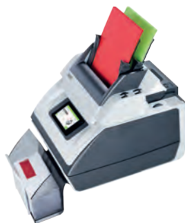
BB FPi 700-2 (2 estaciones)