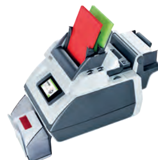
BB FPi 700-3 (2,5 estaciones)