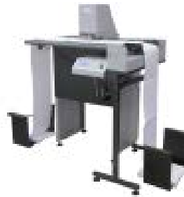
BB TE 62