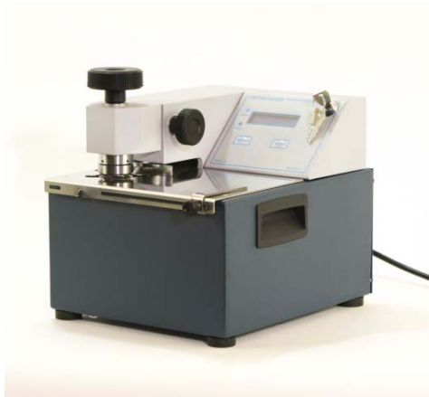
BB TE 2